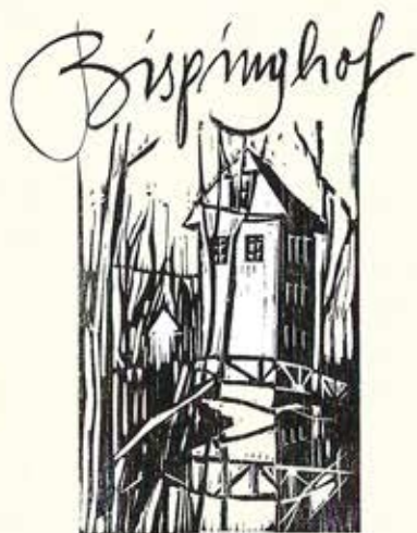
Förderverein Bispinghof e.V.